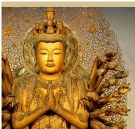
Religion + Geschlecht