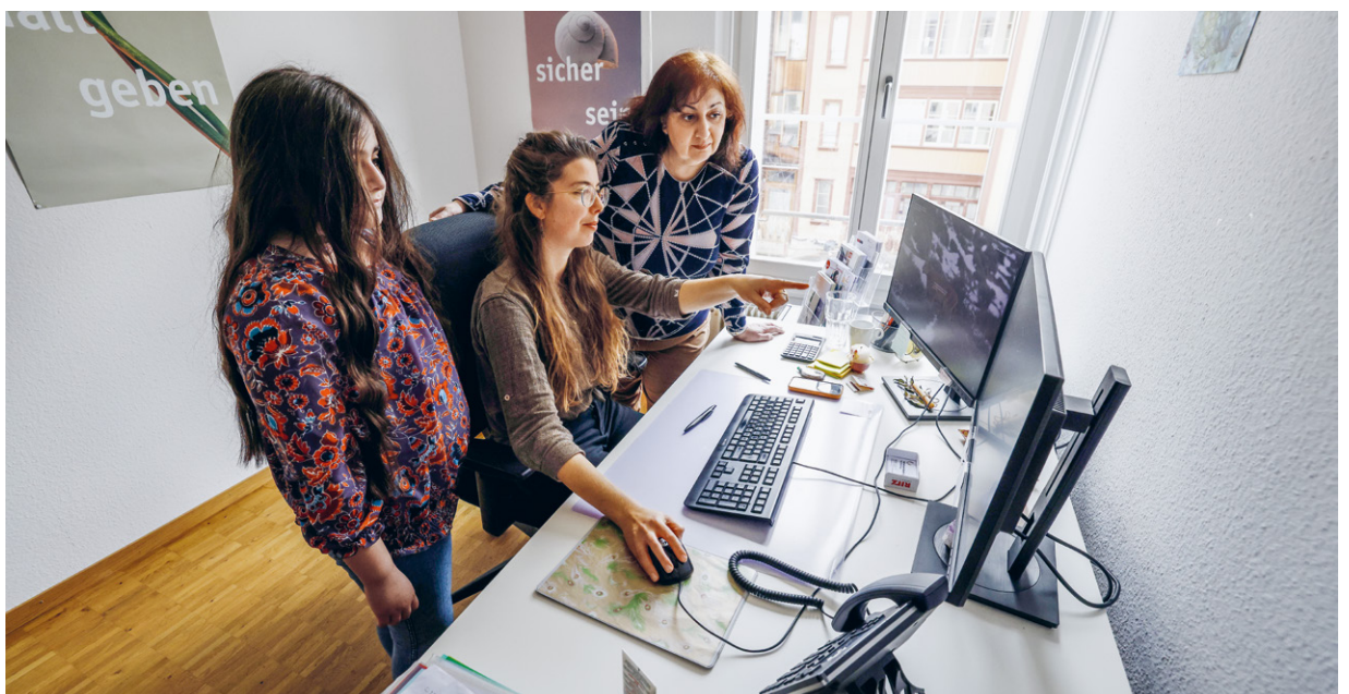
Hilfe zur Selbsthilfe: Die Fachstelle Sozialberatung triagiert die Klient:innen u. a. zu Sozialämtern, Therapeut:innen und weiterführenden Angeboten.

Mehr zur Fachstelle Sozialarbeit www.kathbern.ch/fasa