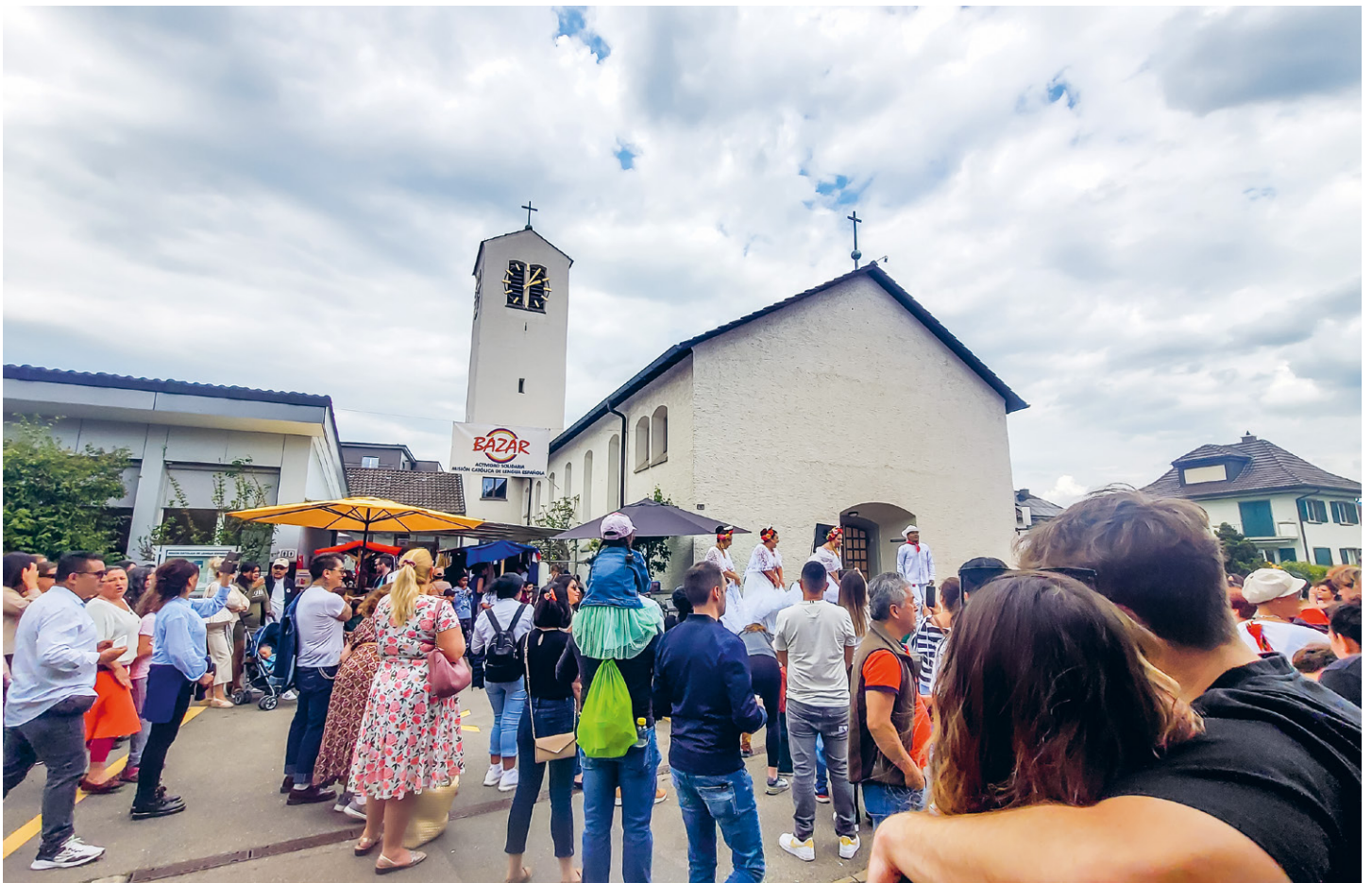
Der BAZAR der spanischsprachigen Mission in Ostermundigen ist jedes Jahr ein Höhepunkt.