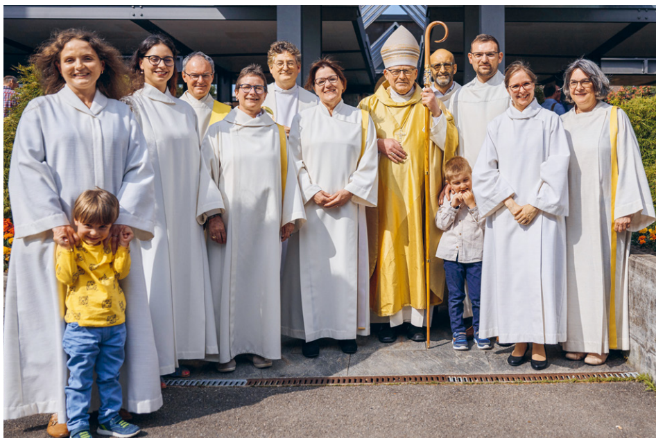
Fünf Frauen entscheiden sich für den Dienst in der Diözese. Zwei weiteren Kandidat:innen erteilte Bischof Stübi die Missio.