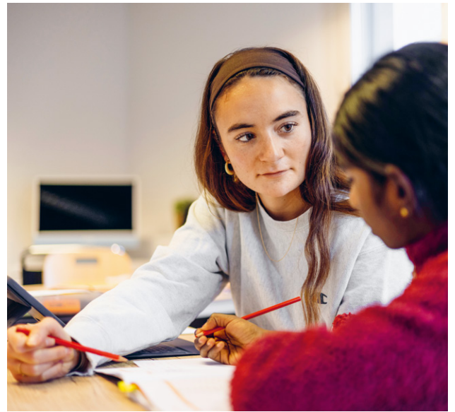
Konzentriertes, individuelles Lernen in kleinen Gruppen.