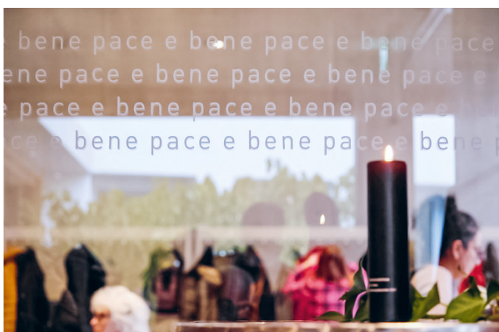
Pfarrei und Gemeinde Zollikofen profitieren von dem neuen Gebäude und den vielfachen Möglichkeiten der Nutzung.