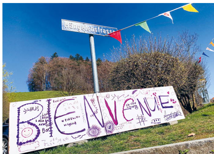
Ob in der Sozialberatung oder in der Quartiersarbeit: Jeder ist willkommen!

Die Sozialarbeit der Katholischen Kirche Region Bern erfährt eine breite gesellschaftliche Unterstützung. Das wird nicht zuletzt an den vielen Freiwilligen deutlich, die sich als Mitglieder der Kirche für andere einsetzen, bei Tischlein deck dich, bei der Ausrichtung von Seniorentreffs oder bei der Betreuung von Menschen, die ihre Angehörigen pflegen, bei der Neugestaltung eines Wohnquartiers oder bei der Integration von Menschen mit Migrationshintergrund, bei Food-