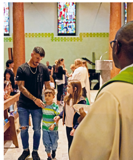
Der Starttag ist ein Anziehungspunkt für junge Familien.