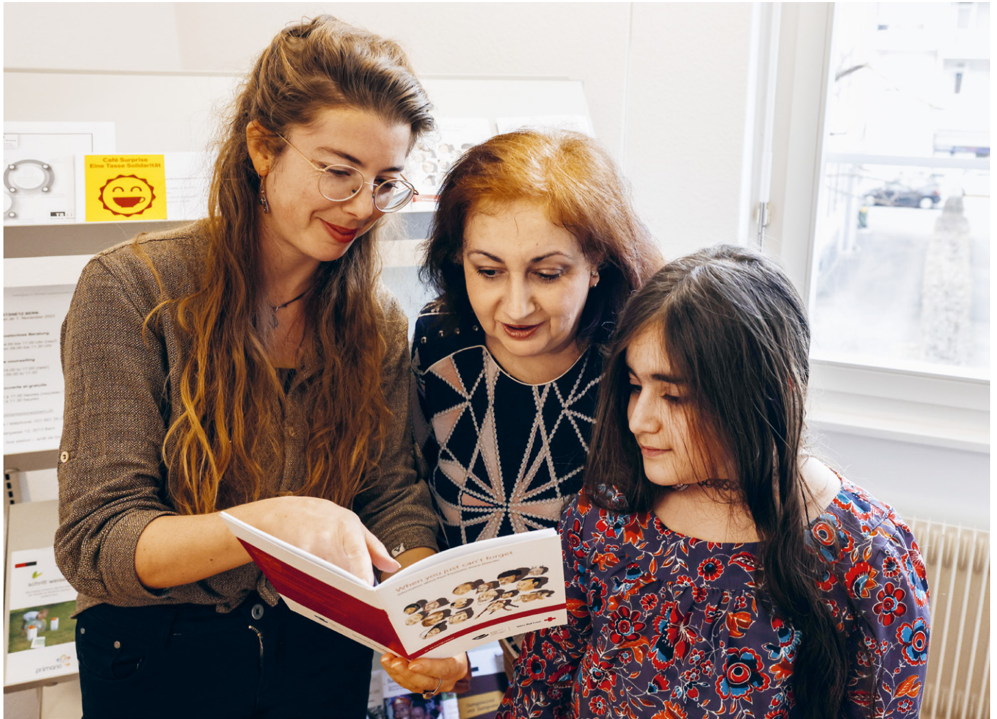
Über 1000 Klient:innen erhalten Unterstützung durch die Sozialberatung, um ihr Leben wieder selbst in die Hand nehmen zu können.