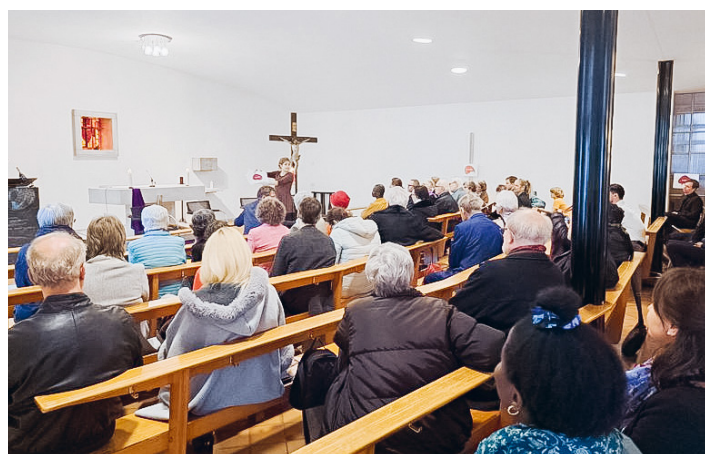
In der Krypta von Bruder Klaus diskutieren Menschen über das Verständnis von Diakonie in einer modernen Gesellschaft.

Die Pfarrei Bruder Klaus ist einer von fünf Orten im Bistum Basel, in denen eine offene Gruppe von Engagierten sich im Sinne eines Pilotprojekts trifft, um miteinander solche Erfahrungen auszutauschen und voneinander zu lernen. Was sind unsere Motivationen? Welchen Platz hat das diakonische Engagement in unserem Leben? Welchen Bezug finden wir dafür im Spiegel der gemeinsamen Bibellektüre und im Gebet? Die Pilotphase Bruder Klaus startete mit einem Besuch des Bischofs im März 2023 und dauert ungefähr ein Jahr. Sie ist zunächst bewusst ergebnisoffen.