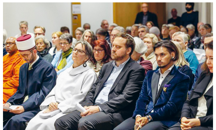
Auch die Trauer verbindet die Religionen nach dem 7. Oktober 2023.