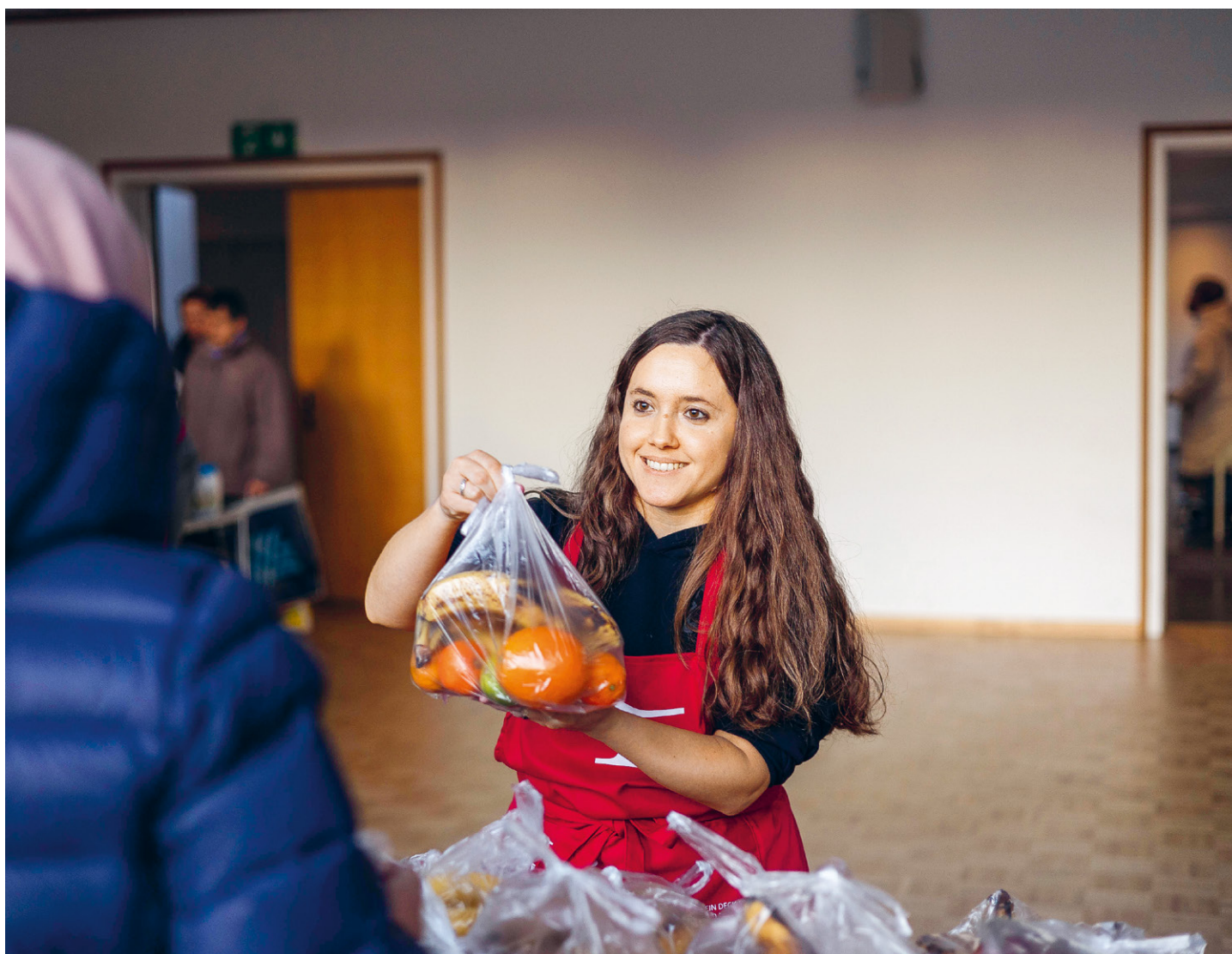
Tischlein deck dich – nun auch in der Pfarrei Bruder Klaus, Bern Burgernziel.

Es gibt also immer wieder, nicht nur in Pandemiezeiten, Situationen, in denen Menschen gefordert sind, näher zusammenzurücken, gerade in einer Zeit, die von Individualisierung und Vereinzelung, aber auch von Polarisierung und Vorurteilen geprägt ist. Das Gemeinsame betonen, die Probleme der Zeit erkennen und gemeinsame Lösungen dafür finden, das zeichnet die Arbeit der Fachstellen der Katholischen Kirche Region Bern aus.