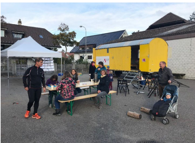
Begegnung beim Spielmobil