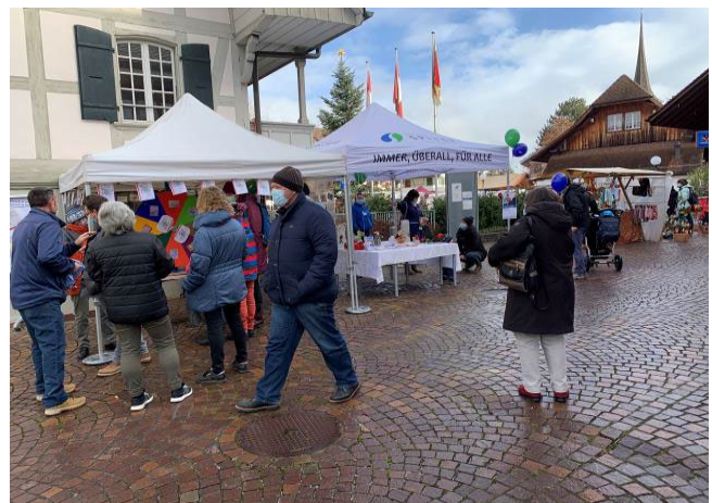
Marktstand Dezembermarkt, 5.12.2021