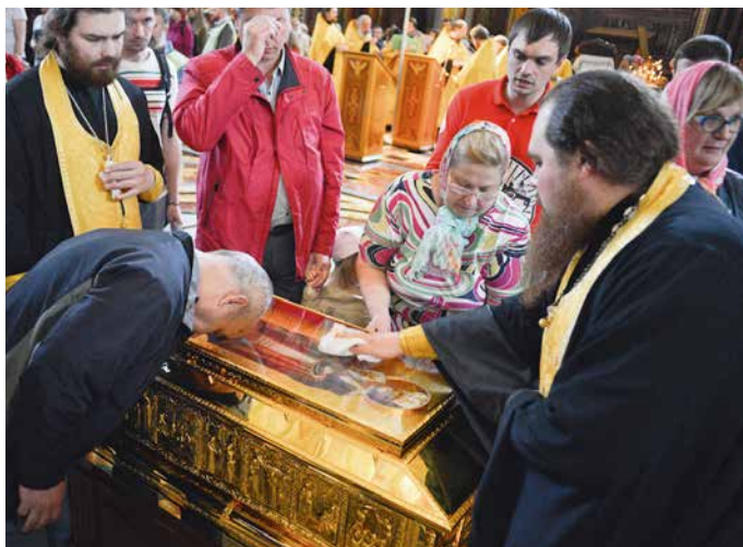
Des milliers de Russes rendent hommage à la relique de saint Nicolas à Moscou.

Il y a un grand saint que nous fêtons dans le temps de l'Avent, mais qui, cependant, est à tel point caricaturé qu'il a perdu de sa notoriété. C'est saint Nicolas de Myre fêté le 6 décembre.