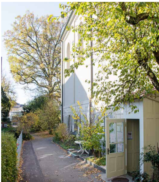
Sous la basilique de la Trinité, l'ancien appartement du sacristain.