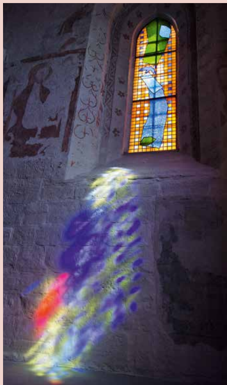
Reflets lumineux à l'église du couvent de la Fille-Dieu à Romont.