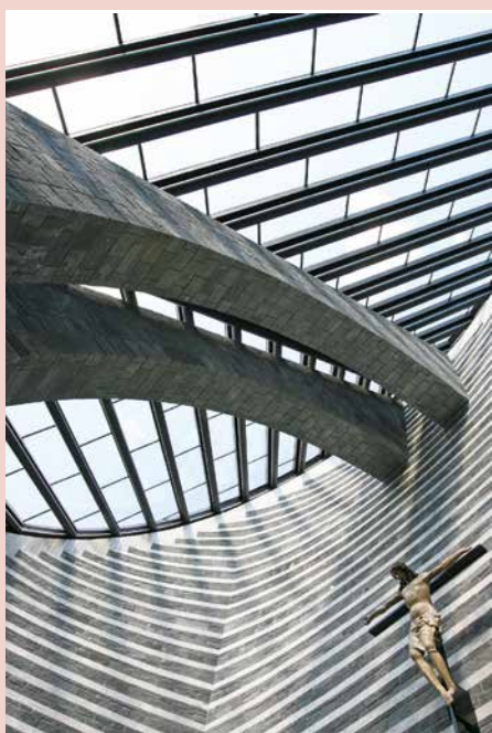
L'église de Mogno, au Tessin, création de l'architecte Mario Botta.

Plus près de nous, l'architecte Mario Botta est le maître d'œuvre de la cathédrale d'Evry qui se distingue par une cheminée ou puits de lumière. On lui doit également plusieurs églises au Tessin: leur forme est au service de la lumière; il est fidèle en cela à l'un de ses illustres prédécesseurs, Charles-Edouard Jeanneret, dit Le Corbusier.