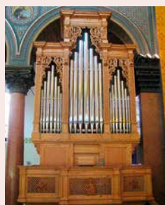
Orgue de chœur Fratti.