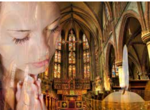
Comment écouter si l'on ne se tait pas?

La mise en scène est donc pensée pour susciter le débat. A priori, celui-ci doit être équilibré. Par exemple, sur les sujets politiques, les chaînes essaient de donner la parole aux différentes tendances politiques, en invitant soit des responsables de partis politiques, soit des journalistes ayant des opinions politiques différentes. Mais est-il possible de s'assurer que le profil des intervenants choisis garantisse cet équilibre? De plus, le téléspectateur peut-il vraiment se convaincre que derrière les arguments énoncés avec un tel aplomb et