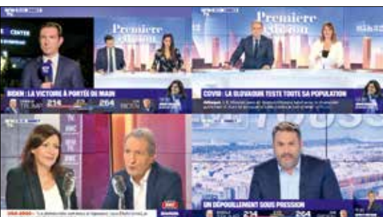
Les chaînes d'info en continu diffusent des heures de débat, souvent stériles.