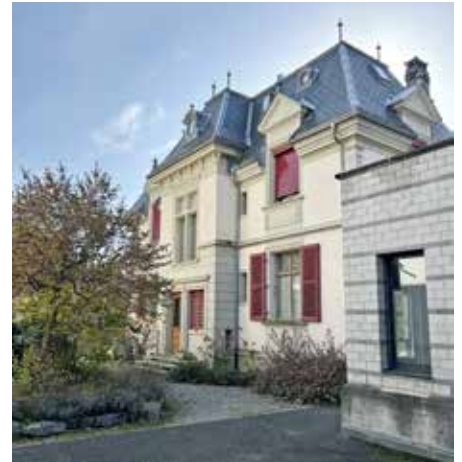
Villa néo-renaissance (1883) Eduard von Rodt, architecte. Cure de la Paroisse.

Les circonstances allaient favoriser notre demande puisque, en même