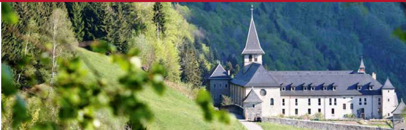
L'Abbaye de Tamié, lieu de ressourcement.

une telle assurance, se dégage une vérité qui met tout le monde d'accord? Pourtant, chacun de nous a soif de savoir quelle est la vérité des choses. On reste sur notre faim avec ce sentiment désagréable d'avoir perdu notre temps et un bon moment de sommeil qui nous aurait fait autant de bien que ces débats stériles souvent émaillés de remarques pas très évangéliques envers les intervenants. N'y aurait-il pas d'autres voies pour discerner ce qui est bon pour chacun et pour la collectivité? Le silence, celui de la nature et des ordres monastiques, par exemple?