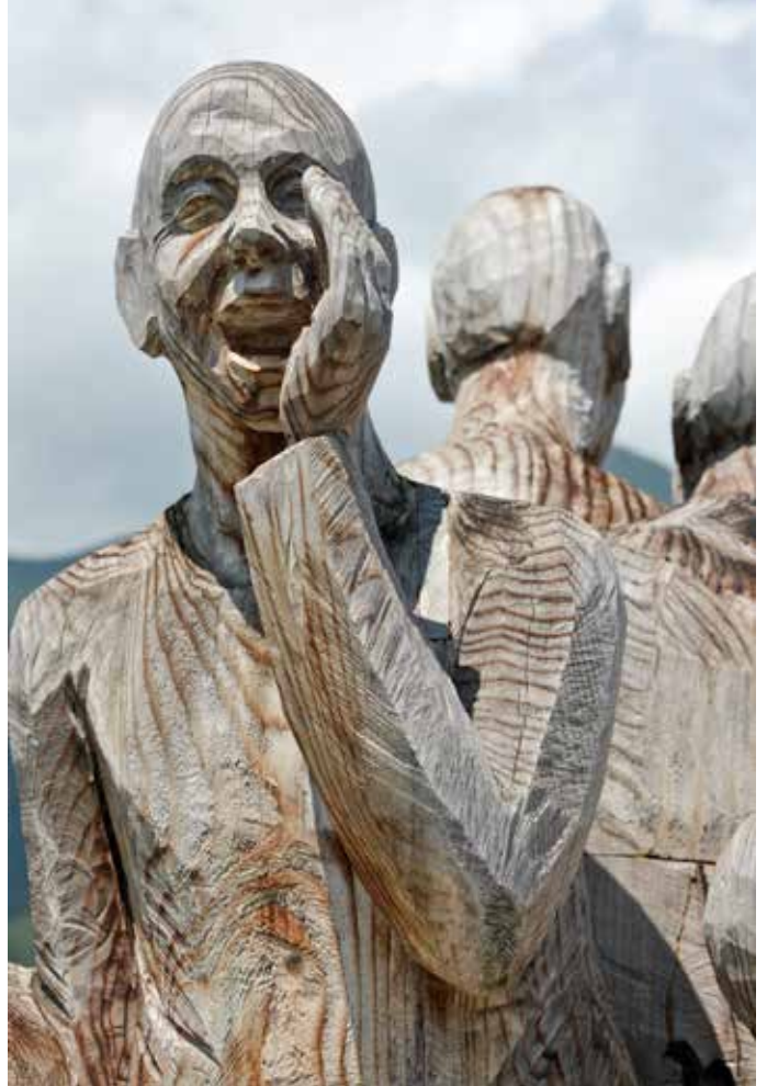
Symposium des sculpteurs sur bois à Brienz, 2015.

Pendant mes vacances dans mon village natal, j'ai eu l'occasion de discuter avec mon cousin qui est instituteur de classes primaires en Valais. Il m'a raconté qu'un jour, dans sa classe et de façon imprévisible, ses jeunes écoliers avaient commencé à émettre des sons.