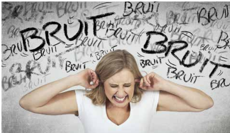
Difficile d'être en silence dans un monde régi par le bruit.

Le maître mot de notre monde actuel, c'est le débat. Il faut débattre de tout. Les chaînes TV, les journaux, les réseaux sociaux nous inondent de personnes aux idées contradictoires qui ne s'écoutent pas et qui se coupent sans cesse la parole. Chacun semble détenir la vérité, mais pour finir, c'est le flou complet. Il faudrait soi-disant suivre ces logorrhées pour se forger une opinion. N'y aurait-il pas d'autres voies pour discerner ce qui est bon pour chacun et pour la collectivité?