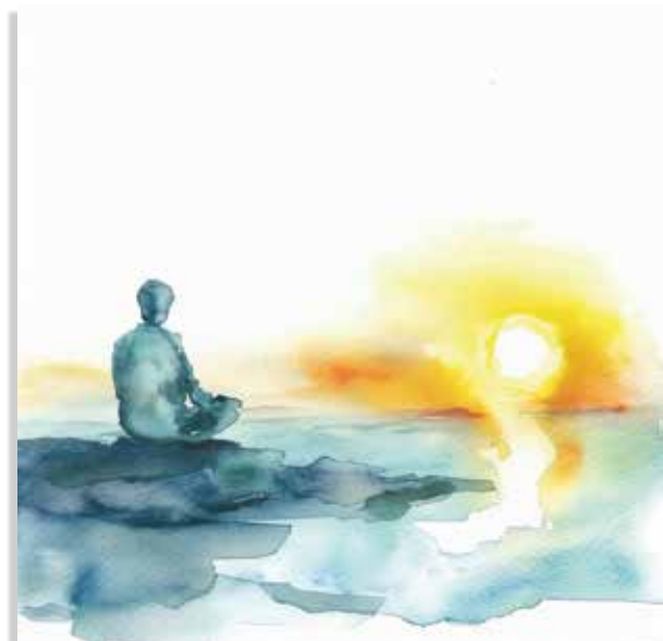
Méditation sereine en silence.