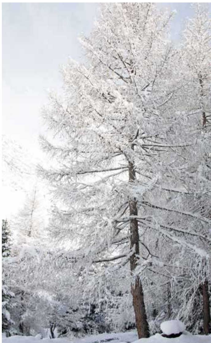
L'hiver, le flocon de neige et le froid, complices du silence.

La plume l'écrirait noir sur blanc si, dans l'encrier, les larmes n'étaient devenues pluies d'étoiles.