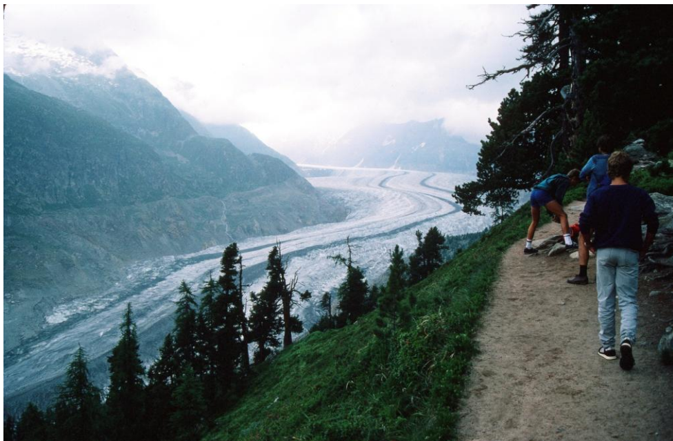
Glacier d'Aletsch en 1984 en haut et 2019 en bas