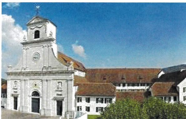
L'abbaye de Mariastein

Aujourd'hui, les clients qui s'arrêtent au restaurant Schlosshof à Dornach peuvent profiter de ce que les chevaliers et les comtes appréciaient autrefois : La cuisine raffinée et une bonne cave. Une vue unique vous est offerte sur les vallées de la Birse, du Leimental, la ville de Bâle, l'Alsace voisine et les Vosges.