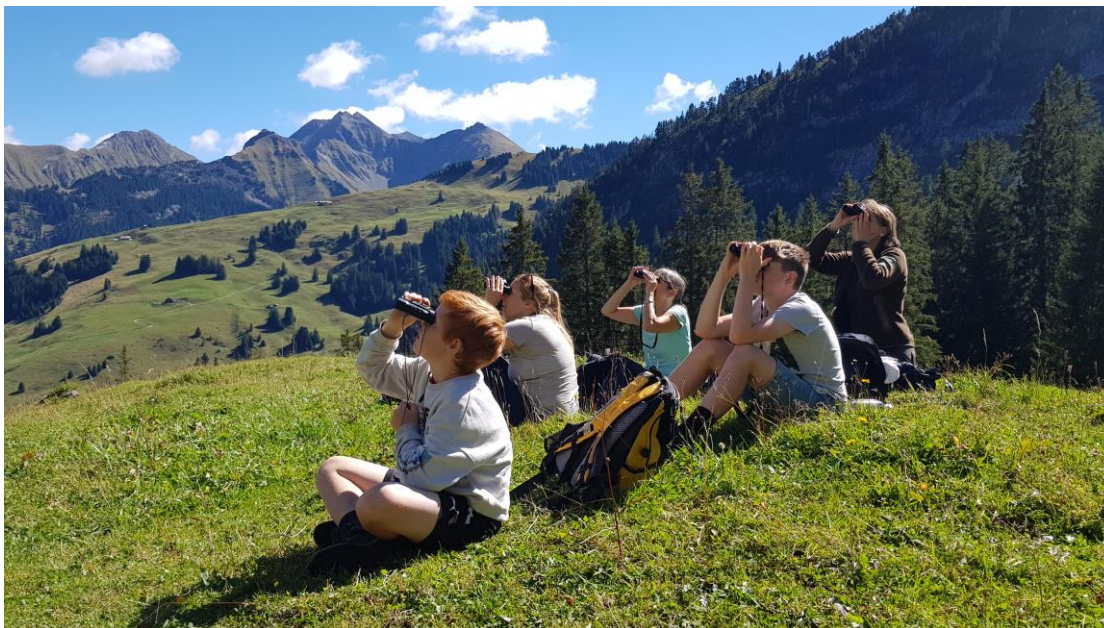
Auf der Minireise auf Wildtier-Expedition im Diemtigtal.