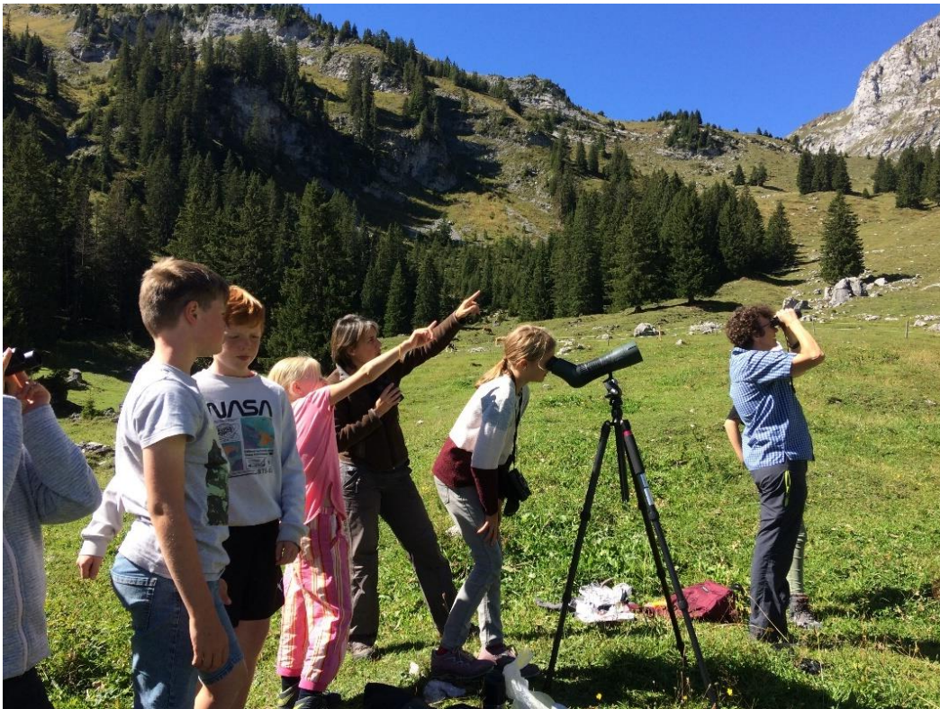
Auf der Mini-Reise 2022 im Diemtigtal