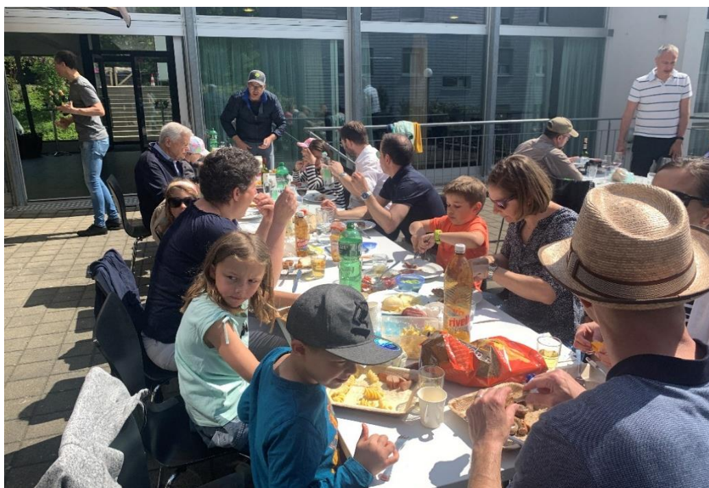
Wieder unkompliziert zusammensitzen dürfen – nach der Corona-Pandemie ein grosses Bedürfnis