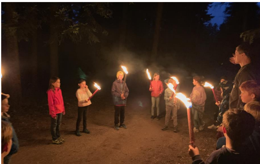
Im Erstkommunionlager 2022