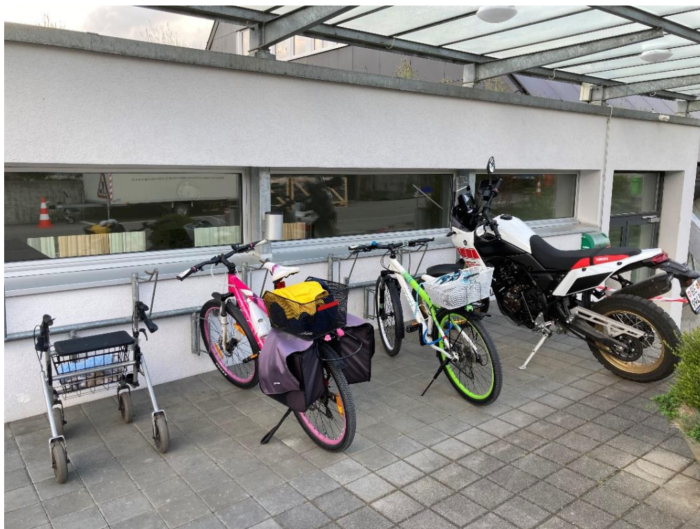
Auf zur Kirche - jede und jeder mit seinem Gefährt!