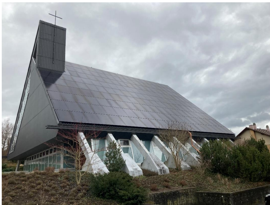
18. Februar 2022: Die Photovoltaik-Anlage auf dem Kirchendach geht ans Netz