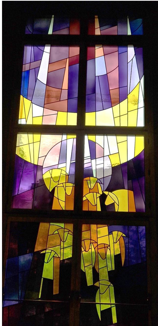
Gut-Hirt-Fenster in Ostermundigen