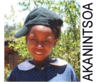
Haus der Mädchen

Katholische Kirche Region Bern Pfarrei Guthirt • Ostermundigen, Stettlen, Ittigen, Bolligen