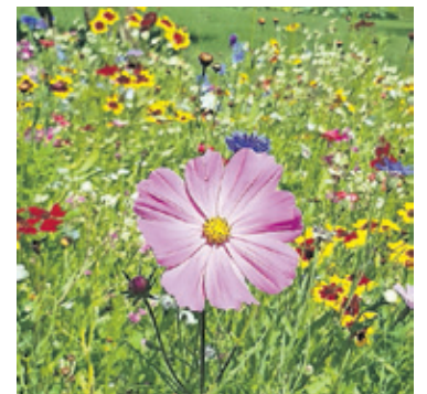
Sommerwiese vor der Kirche Herz-Jesu