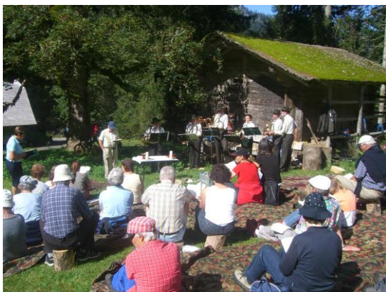
Aus dem Archiv: Suldtal 2007